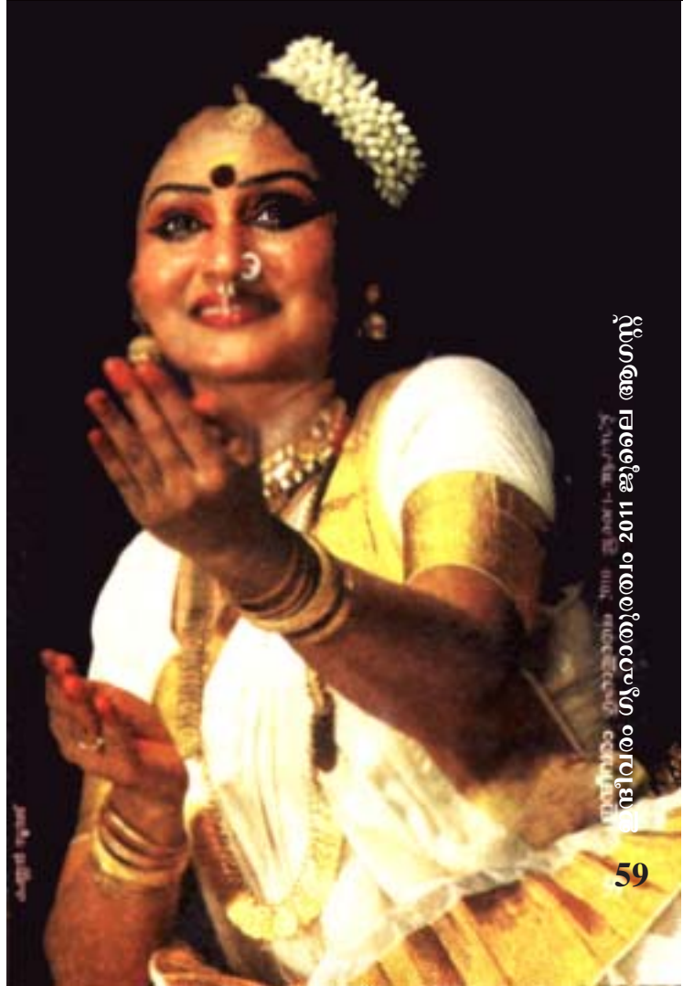
വിനീതം ശൃഹാതുരത്ഥം 2011 ജൂലൈ ആഗസ്റ്റ്