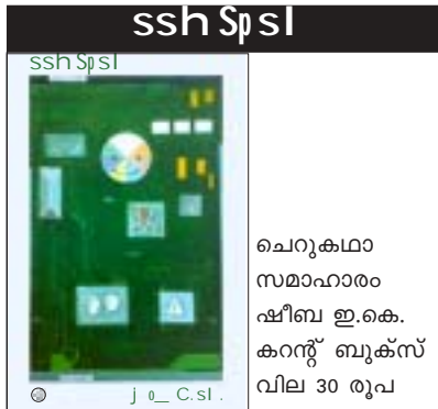
ചെറുകഥാ സമാഹാരം ഷീബ ഇ.കെ. കറന്റ് ബുക്സ് വില 30 രൂപ

ശബ്ദമുണ്ടാക്കുന്നവരെ മാത്രമേ ജനം ശ്രദ്ധിക്കുന്നുള്ളൂ. അല്ലാത്തവരെ തണുത്ത കണ്ണുകൾകൊണ്ട് ഒന്ന് നോക്കി കടന്നു പോകുന്നു. നല്ല വഴക്കമല്ലെന്ന് റിഞ്ഞുകൊണ്ടുതന്നെ നാമെല്ലാം ബഹളമുണ്ടാക്കുന്നവരെ ശ്രദ്ധിക്കുന്നു. ഇതിന്റെ ഫലമെന്താണ്? ഇന്ന് ഏറ്റവുമധികം ശ്രദ്ധിക്കപ്പെടുന്നത് അനാശ്വാസ പ്രവണതകളുടെ സന്തതികളെയാണ്. ഒരുദാഹരണം, ദിവസേനയെന്നോണം പത്രങ്ങളിലും, വാരികകളിലും മറ്റ് ദൃശ്യമാധ്യമങ്ങളിലും പ്രത്യക്ഷപ്പെടുന്ന ക്രിമിനലുകളാണ്. നല്ല കാര്യം ചെയ്യുന്നവരെ, അവർ മാധ്യമങ്ങളിൽ നിറഞ്ഞുനിൽക്കുന്നില്ല എന്നതുകൊണ്ടുതന്നെ, ആരും ഓർക്കുന്നില്ല. സാഹിത്യത്തിലും ഇതുതന്നെയാണ് അവസ്ഥ. പഴയ ഡ്രൈവ്സ് ഗുഡ് മണി തന്നെ. 'ബാഡ് മണി ഡ്രൈവ്സ് ഗുഡ് മണി ഔട്ടോഫ് സർക്യൂലേഷൻ.'