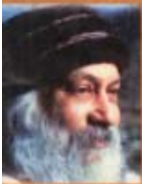
അറിയപ്പെടാത്ത മാർക്കോ മാ ബോധി പ്രയാഗ